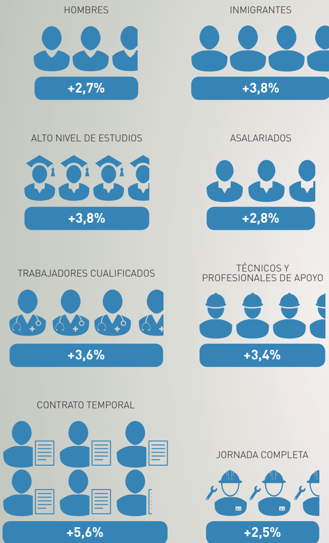
GRUPOS Y CARACTERÍSTICAS DE EMPLEO CON CRECIMIENTOS POR ENCIMA DE LA MEDIA DEL +2,5% DEL CUARTO TRIMESTRE DE 2014